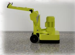
Flexibler Schleifdruck 121-205kg